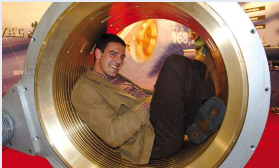
I 2007 havde vi besøg af de to australske rørproducenter PPI og Vinidex, der begge har succes med at bruge RIVAL® justerbar kalibrator i produktionen.

der under drift kan justere de toleranceforskelle, der er til selve kalibreringen afhængig af godstykkelse, råmateriale, ekstruder output, trækbenkens hastighed, køling og vakuum niveau.