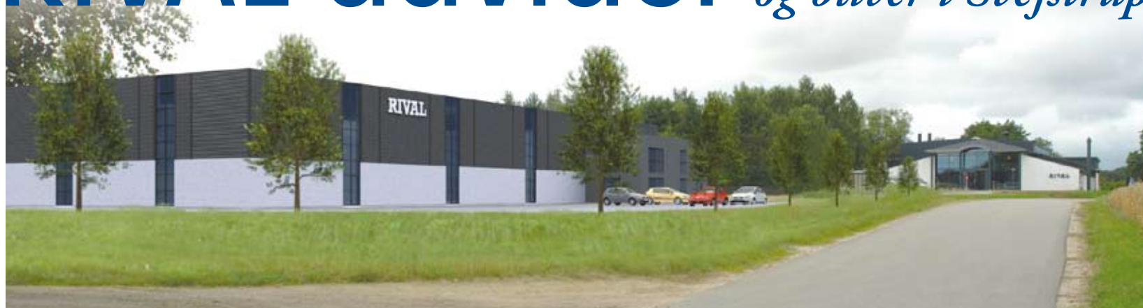
RIVALs nye produktionshal i mursten og glas.

Maskinfabrikken RIVAL er ved at vokse ud af sine lokaler, der blev opført tilbage i tresserne. Derfor udvider virksomheden nu med en ny fabriksal på grunden i Svejstrup.